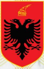
Tabela e përmbajtjes: